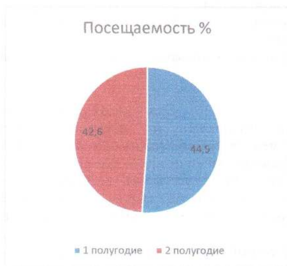
Пропуски по болезни на 1 ребенка